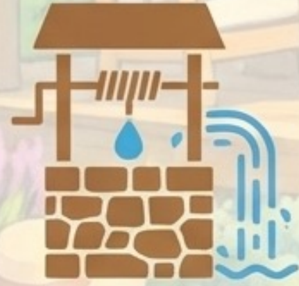
Artezyen Su Kuyusu

Ruhsat projesinde yer alan ve siteye ait planlanmış donatılar: